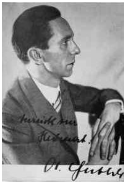
Figura 16 Goebbels

società civile. Grande importanza ebbe il Fronte del lavoro, un'organizzazione gestita dal partito che inquadrava tutti i <<lavoratori del braccio e della mente>> dal punto di vista sindacale, assistenziale e persino ricreativo. Soppressa ogni libera attività sindacale, lo stato controllava direttamente tutti gli aspetti della vita lavorativa e produttiva attraverso l'immensa macchina burocratica delle corporazioni. Allo stesso modo il regime nazista irreggimentò la formazione dei giovani (attraverso il controllo sulla scuola e le attività della Gioventù hitleriana), la cultura, la scienza (moltissimi furono gli intellettuali costretti a prendere la via dell'esilio perché ebrei o contrari al regime: bastino per tutti i nomi di Albert Einstein, Thomas Mann e Bertolt Brecht). L'onnipotente Paul Goebbels (1897 – 1945), responsabile della cultura e della propaganda, fece di quest'ultima una delle armi fondamentali