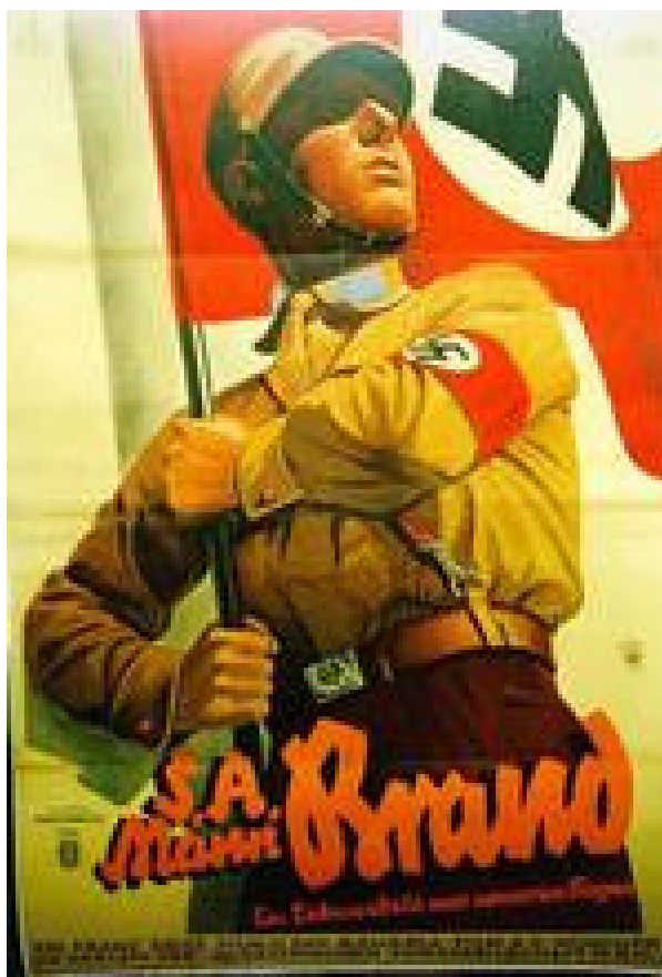
Figura 12 Poster delle SA

Grande ammiratore di Mussolini, aveva anche organizzato delle squadre militari (le S.A, Sturm Abteilungen , “Reparti d’assalto”) per colpire i militanti della sinistra. Con questi strumenti tentò nel 1923 un colpo di stato in Baviera: fu un fallimento e Hitler venne arrestato e imprigionato.