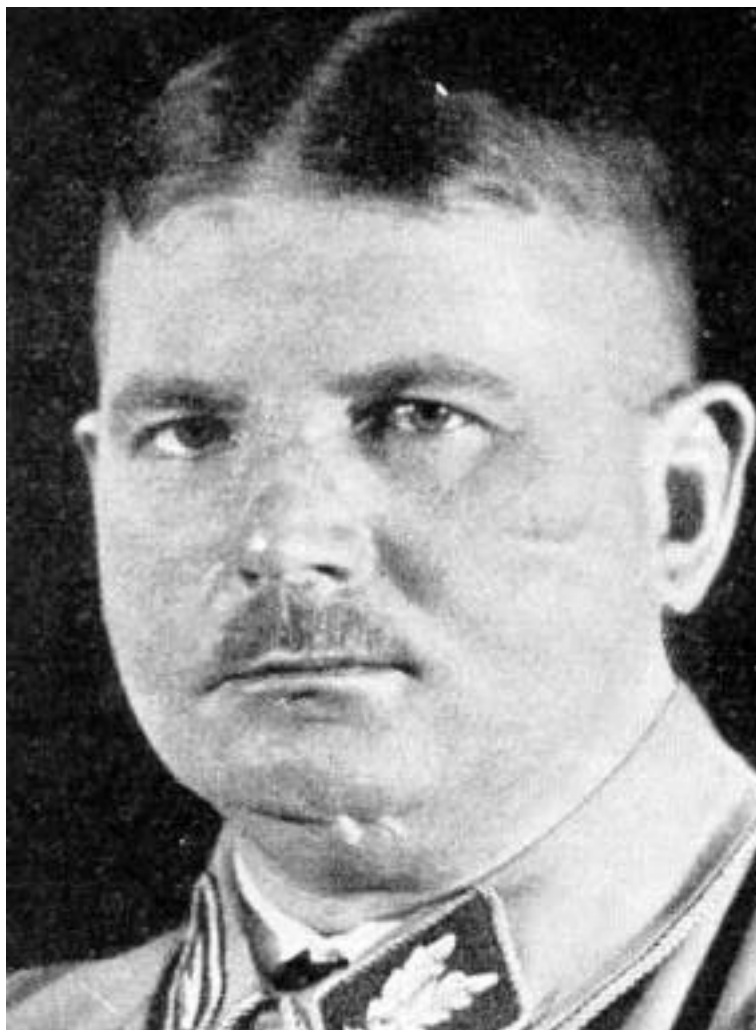
Figura 13 Ernst Rohm comandante delle SA

successivamente raccolte nel libro Mein Kampf ( la mia lotta), pubblicato nel 1925. Per tutti gli anni venti il Partito nazionalsocialista ottenne consensi molti modesti, ma nelle elezioni del settembre 1930 balzò al 18,3% dei voti, divenendo il secondo partito tedesco dopo la Spd, e nelle successive del luglio 1932 risultò primo con il 37,4 per cento dei voti.