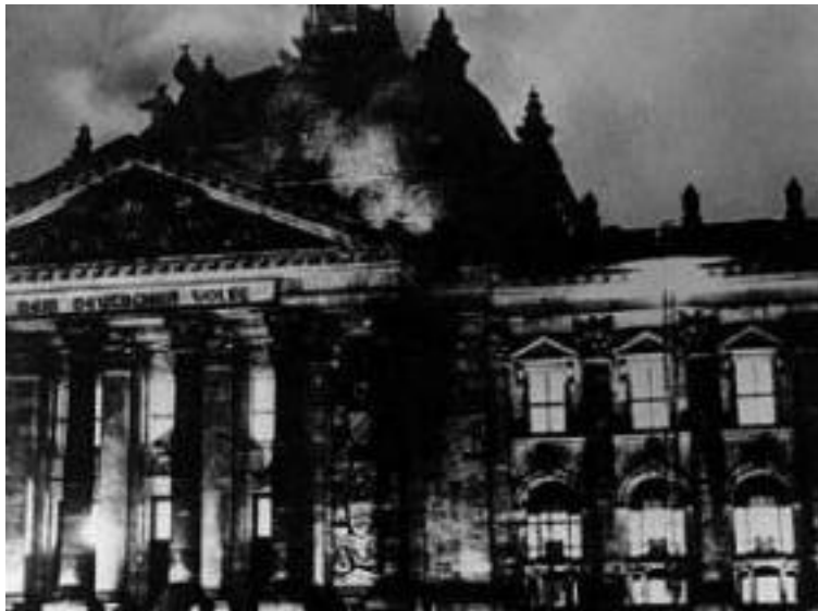
Figura 14 Incendio del Reichstag

L'incendio del Reichstag , il parlamento, falsamente attribuito ai comunisti, fornì il pretesto per una “retata” in grande stile: oltre 4000 militanti comunisti e molti liberali e socialisti furono arrestati. Al voto, Hitler ottenne il 43,9% dei suffragi, che sommato all'8% dei suoi fiancheggiatori nazionalisti gli assicurava la maggioranza assoluta in parlamento.