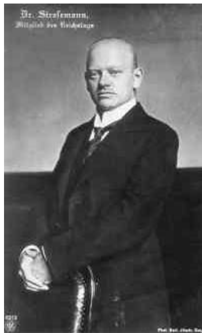
Figura 11 Gustav Stresemann

La situazione tedesca si stabilizzò, provvisoriamente, a partire dal 1924, con la reazione di una nuova moneta, il “marco di rendita” ( Rentenmark ), garantito dal patrimonio pubblico e con l'aiuto economico fornito dalle potenze occidentali, in particolare dagli americani, convinti che fosse necessario favorire la ripresa economica della Germania sia per garantire il formarsi di una potenza stabile al centro del continente, sia per dare impulso ai commercianti internazionali. Il piano Dawes (dal nome del finanziere americano che lo progettò e diresse) garantì ampi finanziamenti all'industria tedesca, che riprese a produrre con elevati ritmi di crescita. Al tempo stesso, il governo di coalizione diretto dal conservatore Gustav Stresemann (1878 – 1929) stipulò con la Francia il trattato di Locarno (ottobre 1925), che stabilizzava la