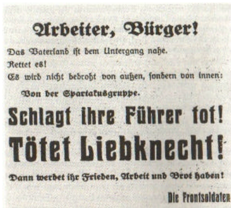
Figura 7 Manifesto apparso nel 1918 sui muri di Berlino che incita ad uccidere il capo degli spartachisti Liebknecht

comunista tedesco), avevano come programma la rivoluzione socialista, che, nella visione della Luxemburg, si sarebbe dovuta attuare attraverso la presa del potere da parte dei consigli degli operai e dei soldati.