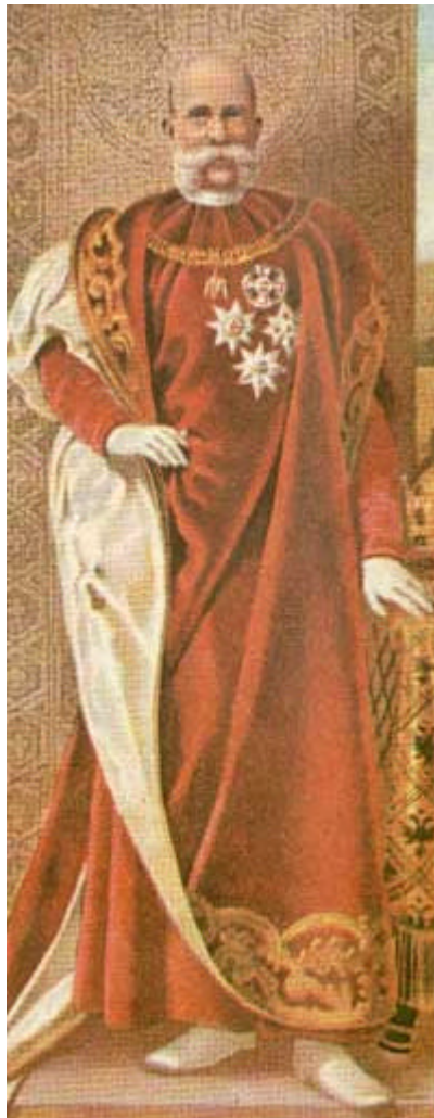
Figura 2 Francesco Giuseppe I