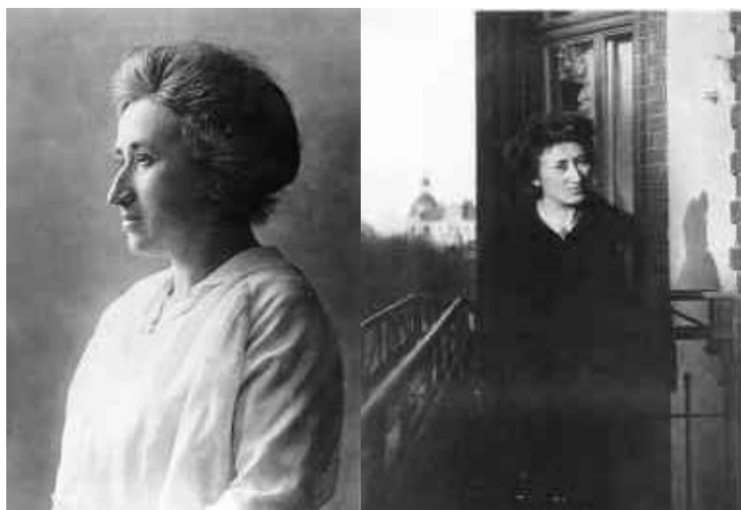
Figura 8 Rosa Luxemburg

Oltre ai socialisti, un altro centro di potere era però rimasto in vita nella disgregazione generale dello stato: la alte gerarchie militari, dominate dalla figura prestigiosa del maresciallo