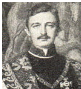
Figura 3 Carlo I d'Asburgo

Inizialmente, la repubblica fu retta, con risultati positivi, da un governo di coalizione fra le due principali forze politiche: i socialdemocratici, che raccoglievano i loro consensi in massima parte a Vienna, una metropoli di grande vivacità politica e culturale, con una grande concentrazione operaia e un esteso ceto medio di professionisti e impiegati, e i