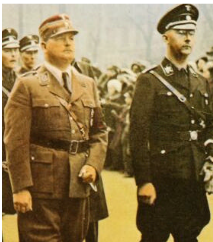
Figura 15 Rohm e Himler

alternativo e politicamente inaffidabile. Alla morte di Hindenburg, nell'agosto 1934, Hitler assunse anche la carica di capo dello stato, concentrando su di sé tutti i poteri. Già alla metà del 1934, dunque, lo stato totalitario nazista poteva dirsi costituito. Hitler attuò una completa fusione fra partito e stato, il che significa che non esistevano più organi istituzionali in grado di esprimere una volontà politica autonoma o comunque diversa da quella del partito e del suo capo, il Führer (“capo”, “condottiero”).