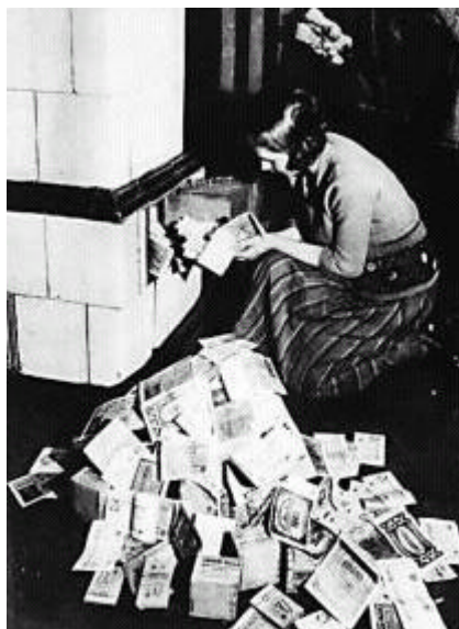
Figura 10 Inflazione in Germania

condizioni di pace imposte dai vincitori – ricordiamo che le sole riparazioni di guerra ammontavano a 132 miliardi di marchi oro rendevano più difficile la stabilizzazione economica e sociale. L'occupazione della Ruhr , la maggiore zona industriale tedesca, attuata nel 1923 dalla Francia e dal Belgio per garantire i propri crediti di guerra, esasperò ulteriormente la situazione. L'inflazione e la svalutazione della moneta raggiunsero livelli impressionanti e devastanti dal punto di vista sociale. Nel gennaio 1921 un dollaro valeva 15,5 marchi, un anno dopo 1800 marchi.