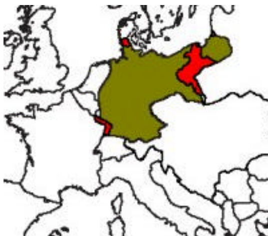
Figura 1 Perdite territoriali della Germania dopo la prima guerra mondiale

La crisi del dopoguerra fu particolarmente lacerante nell'Europa centrale, dove le difficoltà economiche e le tensioni sociali furono esasperate dal peso della sconfitta subita. Nel vuoto di potere apertosi con il crollo di due grandi imperi, quello tedesco e quello austro – ungarico, si mescolarono in modo convulso i tentativi rivoluzionari attuati da una parte del movimento socialista (sull'esempio della rivoluzione bolscevica), la volontà delle vecchie classi dirigenti di conservare e di riorganizzare il loro predominio, il disorientamento e il risentimento dei ceti medi urbani.