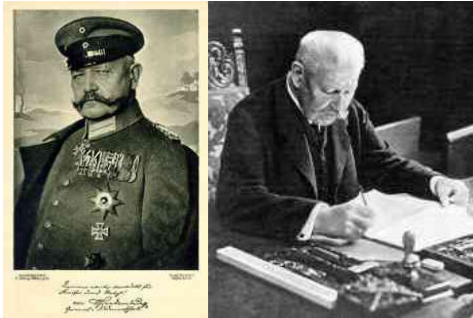
Figura 9 Hindenburg

prussiano Paul von Hindenburg (1847 – 1934), comandante supremo dell'esercito tedesco dal 1916. Eredi del militarismo e del conservatorismo prussiano, queste forze ritenevano prioritario riportare l'ordine nel paese, contrastando il predominio delle sinistre.