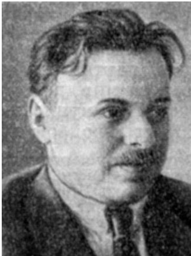
Figura 4 Bela Kun

Assai più drammatica fu la crisi del dopoguerra in Ungheria. Qui, dopo la proclamazione della repubblica parlamentare (16 novembre 1918), i socialdemocratici diedero vita con i comunisti (che avevano i loro punti di forza nei consigli operai sorti in molte fabbriche) a un regime di tipo socialista, la repubblica sovietica ungherese, proclamata il 21 marzo 1919 e guidata dal comunista Bela Kun (1886 – 1936).