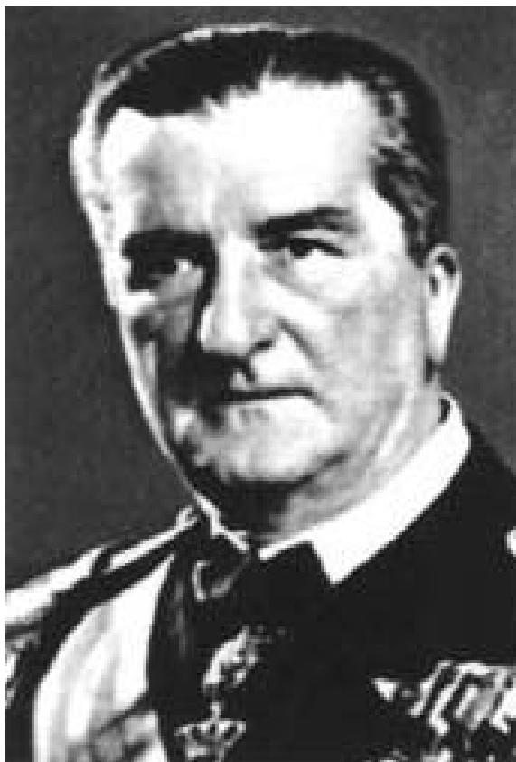
Figura 5 Horthy

1919, in seguito all'intervento di truppe rumene guidate dall'ammiraglio Miklos Horthy (1868 – 1957), che attuò una violenta repressione contro i comunisti e instaurò in Ungheria un regime autoritario destinato a durare sino alla seconda guerra mondiale.