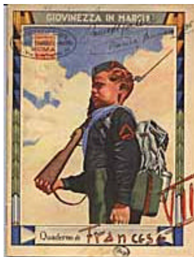
Figura 2 Balilla

Nella scuola furono introdotte due nuove materie (cultura militare e cultura fascista) e acquistò grandissima importanza l'educazione fisica: gli Italiani dovevano essere un popolo di atleti e di guerrieri, degni dei loro antenati romani; pertanto, la propaganda esaltò il Duce, proponendone le gesta improntate alla fisicità (Mussolini <<nuotatore>>, <<trebbiatore>>).