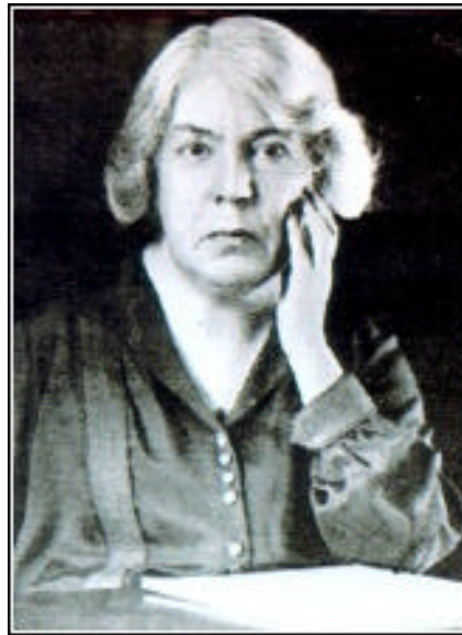
Figura 4 Grazia Deledda