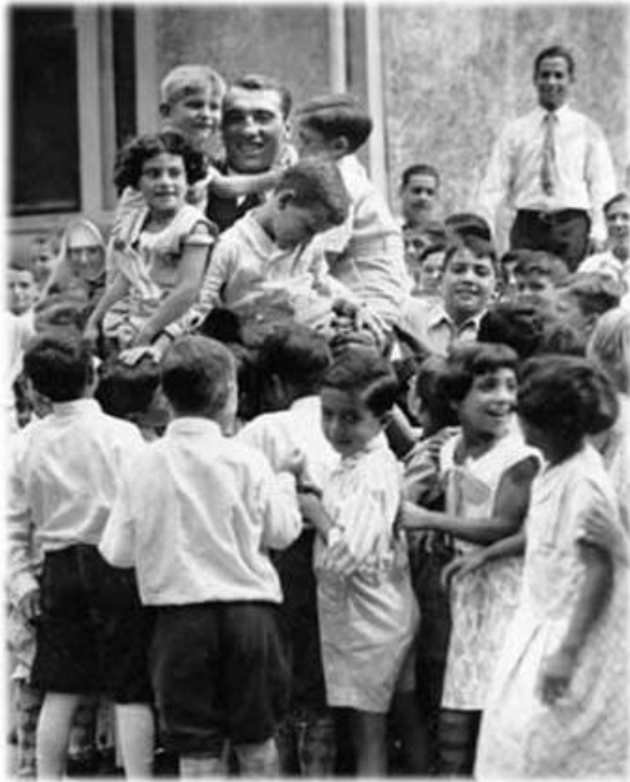
Figura 5 Primo Carnera

regime, per diffondere tra i giovani l'ideologia fascista basata sulla concezione di uno Stato forte e autoritario: gli <<azzurri>> di calcio ottennero due clamorose vittorie nella Coppa del mondo (1934 e 1938) e alle Olimpiadi del 1936; nel pugilato Primo Carnera (1933) conquistò il titolo mondiale dei pesi massimi.