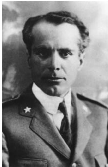
Figura 7 Umberto Nobile

trasvolata del Polo Nord in dirigibile (Nobile, 1926 e 1928: quest'ultima impresa si concluse tragicamente). Si trattò di grandi momenti di esaltazione collettiva.