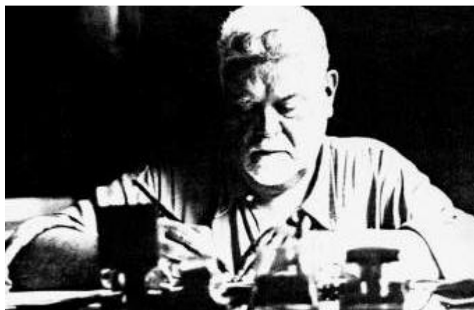
Figura 3 Giovanni Gentile

Nel 1923 la riforma della scuola del filosofo Giovanni Gentile, allora ministro della pubblica istruzione, imponeva la scelta, dopo le scuole elementari, fra l'avviamento professionale (destinato all'esclusivo esercizio di una professione) e la scuola media (aperta agli sviluppi successivi dell'insegnamento scolastico):