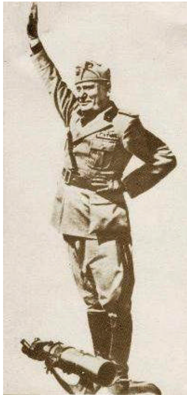
Figura 1 Saluto romano