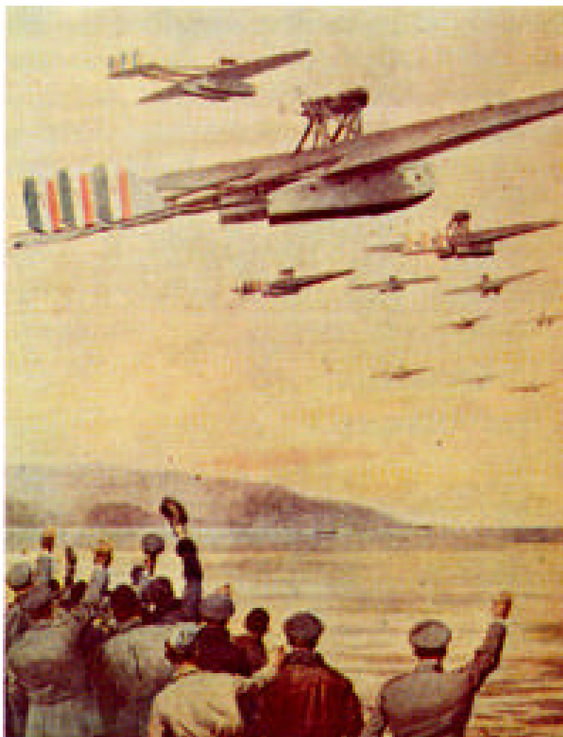
Figura 6 Manifesto commemorativo della trasvolata dell'Atlantico

nedo, 1925); prime trasvolate atlantiche in formazione (Italo Balbo, nel 1930 con 12 apparecchi e nel 1933 con 24);