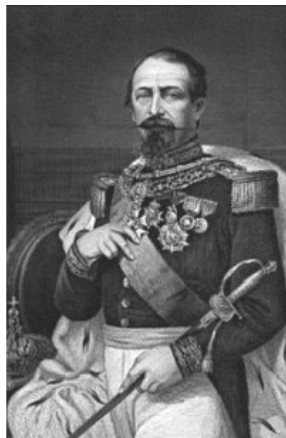
Figura 7 Napoleone III

Il Trentino e la Venezia Giulia rimanevano ancora esclusi dal territorio nazionale. La presa di Roma Mentre i governi della Destra che succedettero a Cavour, forti dell'appoggio di Napoleone III (ricorda il convegno di Plombieres del 1858),