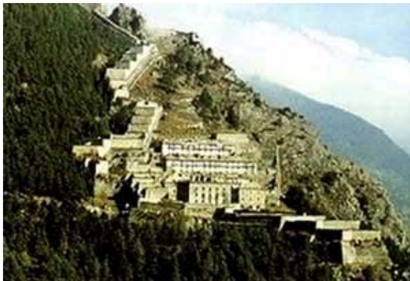
Figura 1 La fortezza sabauda di Fenestrelle in cui furono rinchiusi ufficiali dell'esercito borbonico

La legge elettorale risalente al 1860 era caratterizzata dall'elevatezza del censo: il diritto elettorale attivo (diritto di partecipare alle elezioni come elettore; quello passivo, invece, consiste nel diritto di porre la propria candidatura alle elezioni) fu riservato ai cittadini che avessero compiuto i 25 anni, sapessero leggere e scrivere e pagassero 40 lire di imposte dirette l'anno. Nel primo ventennio dello Stato unitario gli aventi diritto al voto furono il 2% dell'intera popolazione, cioè il 7% dei maschi adulti. Il <<paese reale>> era costituito da milioni di lavoratori, per il 65% dediti all'agricoltura. L'80% della popolazione era analfabeta, con punte più elevate nel Mezzogiorno; a parte i Toscani e i Romani, gli abitanti del regno in grado di padroneggiare l'italiano erano meno di 200.000, mentre il resto faceva uso di dialetti. Il disagio della vita dei ceti popolari era accentuato dalla mortalità infantile, dalle ristrettezze dell'alimentazione, dal basso livello igienico e dal degrado delle popolazioni.