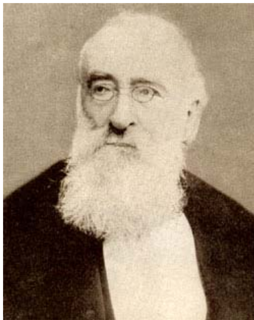
Figura 6 Depretis

assunto dalla Destra storica , gruppo dirigente liberal - moderato, erede della tradizione di Cavour (morto il 6 giugno 1861). La Destra restò al governo dal 1861 al 1876 ; era costituita da esponenti dell'aristocrazia, favorevoli alla soluzione unitaria e monarchica del Risorgimento, e dell'alta borghesia finanziaria e agraria. Alla Destra si contrappose la Sinistra , il raggruppamento liberal - progressista nato dall'unione della Sinistra monarchico - costituzionale del Parlamento piemontese ( guidata da Agostino Depretis) con democratici di provenienza mazziniana o garibaldina (Francesco Crispi). La Sinistra, costituita da esponenti della piccola e media borghesia e delle avanguardie politicizzate delle classi lavoratrici urbane, sosteneva l'allargamento del suffragio, il compimento dell'Unità nazionale, da realizzare, sotto la spinta popolare, con la liberazione di Roma e di Venezia.