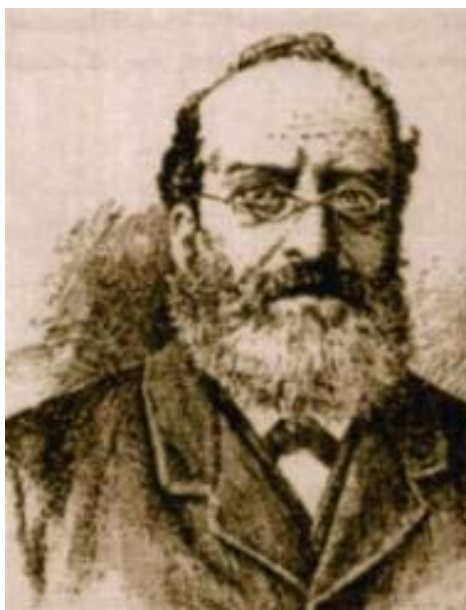
Figura 4 L'onorevole Giuseppe Pica autore dell'omonima legge

La mafia, che si basava sul principio dell'«uomo d'onore», imponeva la sua autorità sui deboli ai quali forniva forme di protezione. Nelle regioni centro-settentrionali, invece, i fermenti sociali sfociarono nei moti del macinato (1869) contro la tassa sulla macinazione; lo Stato rispose inviando l'esercito.