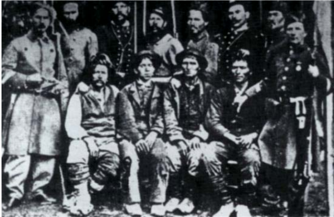
Figura 3 Briganti meridionali

Il brigantaggio meridionale La manifestazione più clamorosa delle tensioni sociali fu il brigantaggio, che sconvolse il Mezzogiorno tra il 1861 e il 1865. Il brigantaggio fu un grande episodio di lotta di classe , che si trasformò in una guerriglia contadina, condotta da centinaia di bande a piedi e a cavallo, che occupavano villaggi e paesi, uccidendo i capi liberali e i maggiori proprietari. La lotta si concluse con la vittoria dello Stato: la legge Pica del 1863 riservava ai tribunali militari il giudizio sui briganti, puniva con la fucilazione chi opponesse resistenza con le armi. In Sicilia agiva un'associazione segreta: la mafia , nata per la diffidenza nutrita verso lo Stato napoletano corrotto.