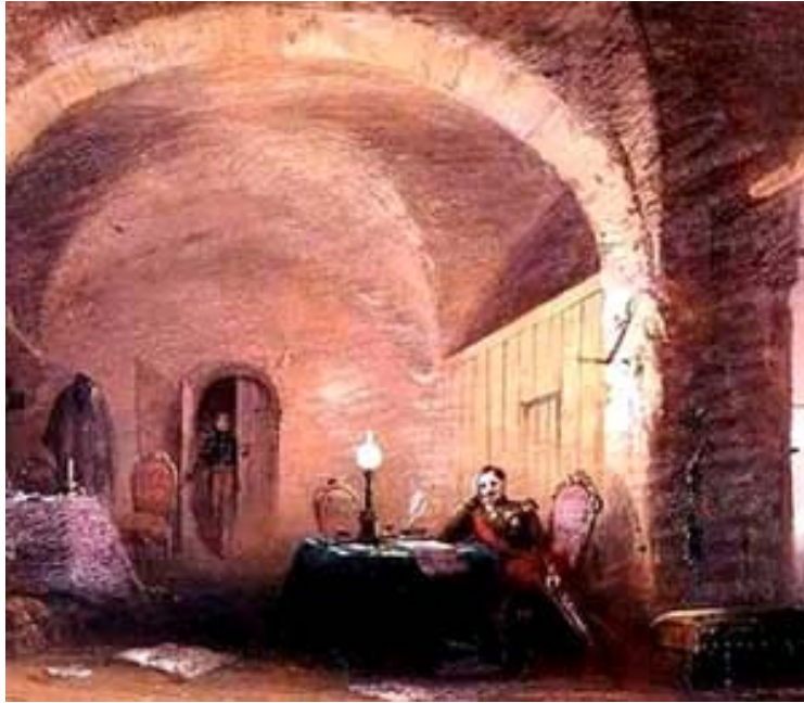
Figura 2 Francesco II di Borbone nella fortezza di Gaeta

Il problema più urgente che dovettero affrontare i governi unitari fu quello della questione meridionale , ossia dell'arretratezza delle regioni meridionali e delle isole rispetto al resto del Paese. Nel 1860/'61 il Mezzogiorno era davvero povero: l'industria era assente, ridotto il commercio, scarse le vie di comunicazione; nei latifondi i contadini e i braccianti agricoli erano soggetti allo sfruttamento dei baroni. Il nome d'Italia significava servizio militare obbligatorio, che privava le terre di braccia di lavoro e tasse, come quella sul macinato che colpiva l'alimento base delle classi più disagiate. Tra le reazioni al governo ci furono il fenomeno dell'emigrazione (tra il 1863 e il 1875 lasciarono l'Italia 123.000 emigranti all'anno) e quello del brigantaggio.