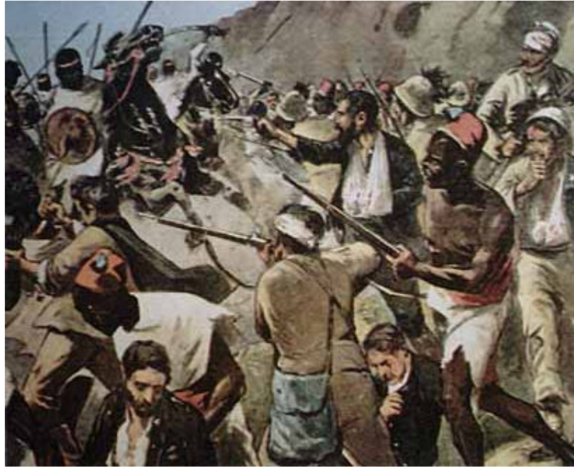
Figura 4 illustrazione popolare di un momento della battaglia di Adua