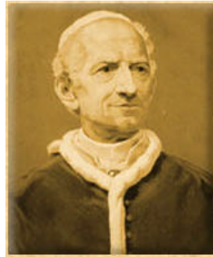
Figura 2 Leone XIII

munismo riteneva necessaria la lotta di classe , per la liberazione del proletariato dallo sfruttamento della borghesia, l'abolizione della proprietà privata dei mezzi di produzione e la realizzazione della dittatura del proletariato . Con la dittatura del proletariato si sarebbe potuti giungere a una società senza classi , in cui le ricchezze fossero comuni e ognuno venisse remunerato in base alle necessità. Una vera e sistematica legislazione del lavoro si ebbe in Germania tra il 1881 e il 1889, con le prime leggi per l'assicurazione degli operai contro malattie, infortuni e vecchiaia. Nel 1891, il papa Leone XIII pubblicò l'enciclica Rèrum Novàrum , in cui, partendo da un punto di vista cristiano, non approvò il principio comunista della lotta di classe, e ricordò ai datori di lavoro e agli operai i loro doveri cristiani, affermando il principio di una retribuzione commisurata alle necessità di sostentamento del lavoratore e della sua famiglia.