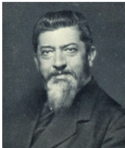
Figura 6 Turati

In Italia l'ascesa del socialismo, nei primi anni del Novecento, si basò da una parte sulla scelta giolittiana favorevole a un'evoluzione democratica del Paese, e dall'altra sull'affermazione all'interno del Partito socialista del gruppo dirigente riformista di Filippo Turati e Claudio Treves.