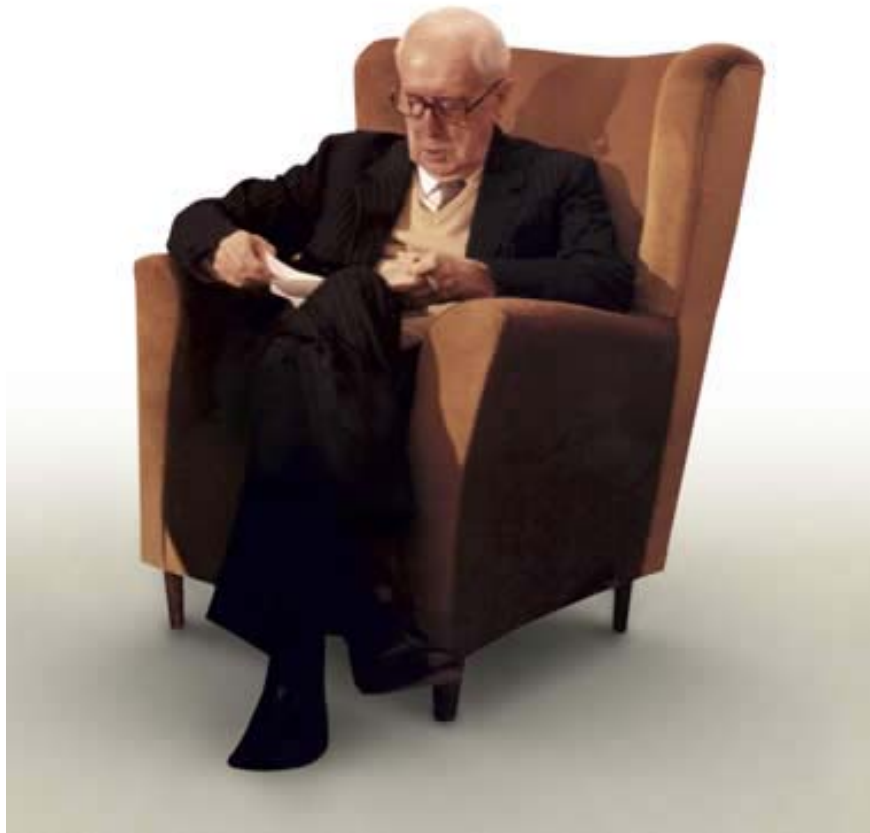
Figura 4 Carlo Bo

Carlo Bo intende la letteratura come <<forse la strada più completa per la conoscenza di noi stessi>>. Cade, così, ogni possibilità di impostare il rapporto arte-vita secondo i canoni dell'estetismo decadente, lungo la linea tracciata in Italia da G. D'Annunzio, secondo il quale la vita doveva essere un'opera d'arte. La letteratura, secondo il critico genovese, deve identificarsi con l'io profondo del soggetto, con la sua dimensione spirituale più autentica. La poesia vive nell'intimo legame dell'individuo con se stesso, al di fuori di ogni legame con la collettività e con le vicissitudini della vita quotidiana.