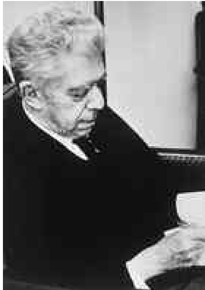
Figura 3 Eugenio Montale

Per quanto riguarda i contenuti, la poesia ermetica rifiuta la concezione oratoria della poesia intesa come celebratrice di ideali esemplari (la religione, la patria, l'eroismo, la virtù, ecc..) e persegue l'ideale della "poesia pura", libera cioè non solo dalle forme metriche e retoriche tradizionali, ma anche da ogni finalità pratica, didascalica, celebrativa, narrativa e descrittiva. Essa esprime, nel modo più autentico ed integrale, il nostro essere più profondo e segreto.