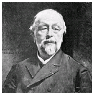
Figura 1 Taine

IL NATURALISMO FRANCESE. I veristi italiani (Luigi Capuana, Giovanni Verga, Federico De Roberto) nell'elaborare le loro teorie letterarie ebbero come punto di riferimento il Naturalismo francese, il quale si affermò in Francia negli anni Settanta dell'Ottocento. La base culturale e filosofica del Naturalismo francese fu il Positivismo , un movimento di pensiero che si diffuse dalla metà dell'Ottocento e che fu l'espressione della nuova organizzazione industriale della società borghese, dello sviluppo della ricerca scientifica e delle applicazioni tecnologiche. Il Positivismo introdusse nella filosofia, nella storia, nella vita morale i metodi delle scienze sperimentali (matematica, fisica, scienze naturali) basate su criteri oggettivi, contrariamente alle tendenze metafisiche e religiose del Romanticismo (movimento culturale affermatosi in Europa nel XIX secolo). Per i sociologi positivisti, la <<legge fissa>> che faceva muovere la società era la molla economica ; secondo questa prospettiva, erano analizzate le classi sociali più umili. Il teorico del Naturalismo fu Hippolyte Taine , secondo il quale, i fenomeni spirituali erano determinati dall'ambiente fisico in cui l'uomo viveva; applicare tale teoria alla letteratura significava analizzare scientificamente la realtà, sulla base del <<principio deterministico>> dell'influenza della razza, dell'ambiente e del momento storico.