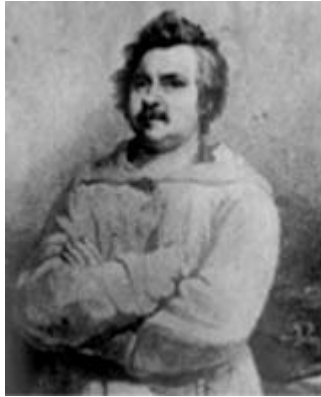
Figura 2 Bălzac

Il Taine proponeva come modello Balzac , autore di quel grandioso quadro della società francese della Restaurazione che è il romanzo Commedia umana , in cui lo scrittore, con la precisione di un chimico, aveva analizzato la natura umana e le sue accezioni patologiche.