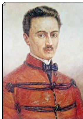
Figura 6 Ippolito Nievo

Agli anni 1857-58 risale il romanzo di Ippolito Nievo Le confessioni di un Italiano (pubblicato postumo nel 1867), in cui, attraverso le memorie del protagonista, si rievocano le vicende di ottant'anni di storia italiana, fino ai moti del '48 [si ricordi, a proposito del romanzo storico, che sin dal 1827 si erano formate 2 scuole: i seguaci di Scott, che si erano allontanati dalla formula del maestro - il romanzo storico doveva riprodurre un'epoca del passato illustrando i risvolti umani di avvenimenti storici nella vita di gente comune - proponevano intrighi avventurosi; i seguaci di Manzoni, invece, lontani dal fine pedagogico ed edificante del romanzo manzoniano, erano più propensi al gusto per il patetico, l'orrido, il tenebroso: Massimo D'Azeglio ( Ettore Fieramosca 1833 ) e Domenico Guerrazzi ( L'assedio di Firenze 1836 ).