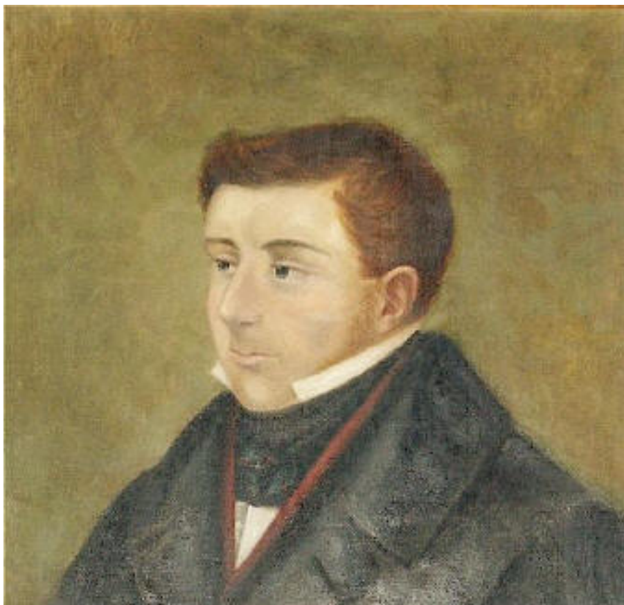
Figura 1 Giovanni Berchet

Il primo Romanticismo italiano è quello definito patriottico-risorgimentale : la maggior parte della produzione poetica, dal secondo decennio in poi dell' Ottocento , è caratterizzata dal desiderio di libertà dallo straniero, della borghesia prima e del popolo "italiano" poi. È il periodo che ispira al Berchet la composizione delle Romanze (1824), in cui l'autore trae ispirazione dalla situazione politica presente ( i moti liberali del '21 in Italia contro gli Austriaci ).