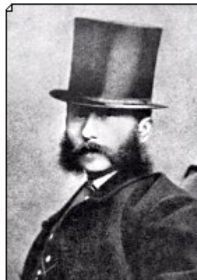
Figura 9 Emilio Praga

Gli scapigliati furono influenzati anche dai poeti del Parnasse , una scuola francese del decennio '66-'76, che mirava a una forma espressiva perfetta. Gli scapigliati, con l'attenzione a ciò che è patologico e con il proposito di analizzarlo con la crudeltà impietosa dell'anatomista, introducono in Italia il gusto del nascente Naturalismo , affermatosi in Francia tra la fine degli anni Sessanta e l'inizio degli anni Settanta. L'esplorazione delle zone oscure della psiche, introdotta dagli scapigliati, anticipa le soluzioni della letteratura decadente (Pascoli, D'Annunzio) e in direzione decadente portano la sensibilità per la mescolanza delle sensazioni, che porta alla fusione dei diversi linguaggi artistici, nonché il culto per la forma espressiva. Al sentimentalismo malinconico della poesia del secondo romanticismo gli scapigliati (tra i poeti ricordiamo Emilio Praga , Arrigo Boito ; tra i prosatori spicca Carlo Dossi ) oppongono il desiderio di identificare l'arte con la vita.