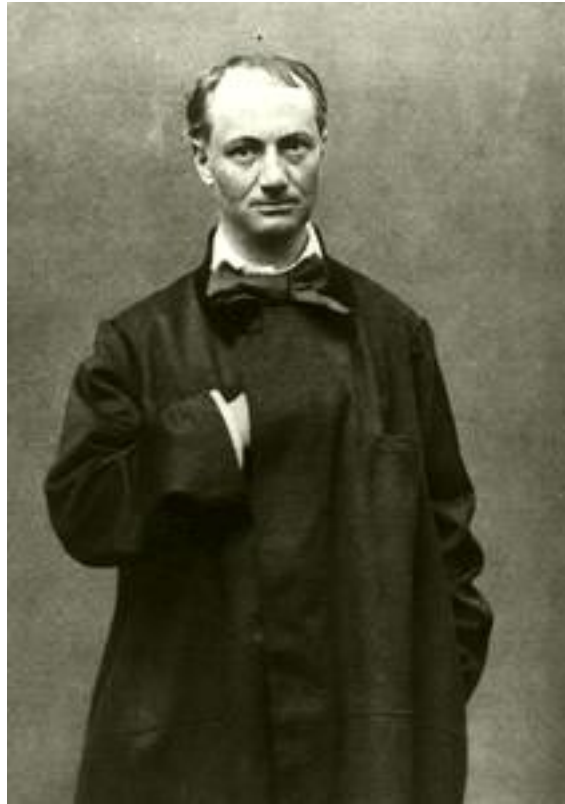
Figura 7 Baudelaire

Il modello ispiratore è il francese Baudelaire , che aveva cantato l'angoscia della vita moderna nelle grandi metropoli.