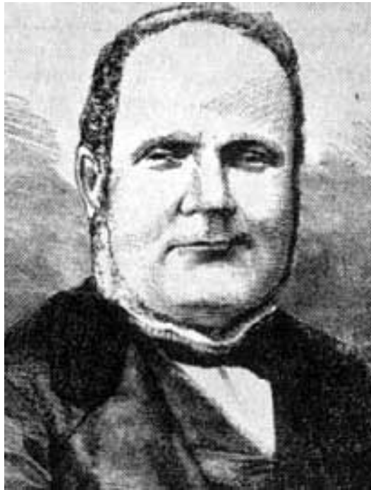
Figura 4 Luigi Settembrini

si sente vivo soprattutto nelle Ricordanze della mia vita (esempio di memorialistica) del napoletano Luigi Settembrini (pubblicate postume nel 1876), in cui l'autore rievoca i 10 anni di carcere scontati per aver partecipato ai moti liberali del '48 a Napoli contro i Borboni .