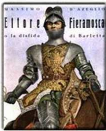
Figura 2 Copertina del romanzo di D'Azeglio

berg (in Moravia). Nel 1833 Massimo D'Azeglio pubblica il romanzo Ettore Fieramosca (lotta tra Francesi e Spagnoli per il reame di Napoli nel 1503), pervaso dal sentimento di italianità; postumo (1867) è il frammento autobiografico I miei ricordi (esempio di memorialistica), concepito da D'Azeglio come un libro di sana educazione civile e patriottica, secondo il principio che, fatta l'Italia, attraverso l'unificazione territoriale, occorreva <<fare gli Italiani>>, divisi da antiche incomprensioni, accentuate da tanto diverse sorti politiche.