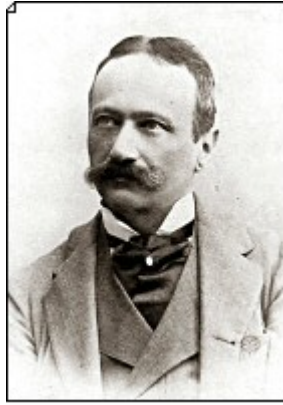
Figura 10 Arrigo Boito