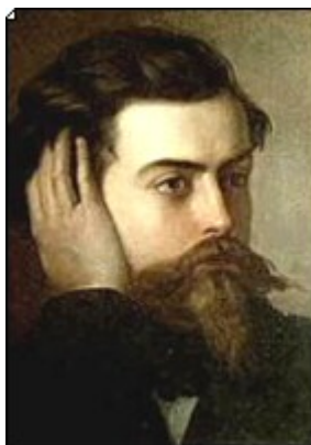
Figura 3 Goffredo Mameli

Nel 1847 il genovese Goffredo Mameli intona l'inno Fratelli d'Italia (divenuto inno nazionale della Repubblica italiana nel secondo dopoguerra). Il fremito patriottico