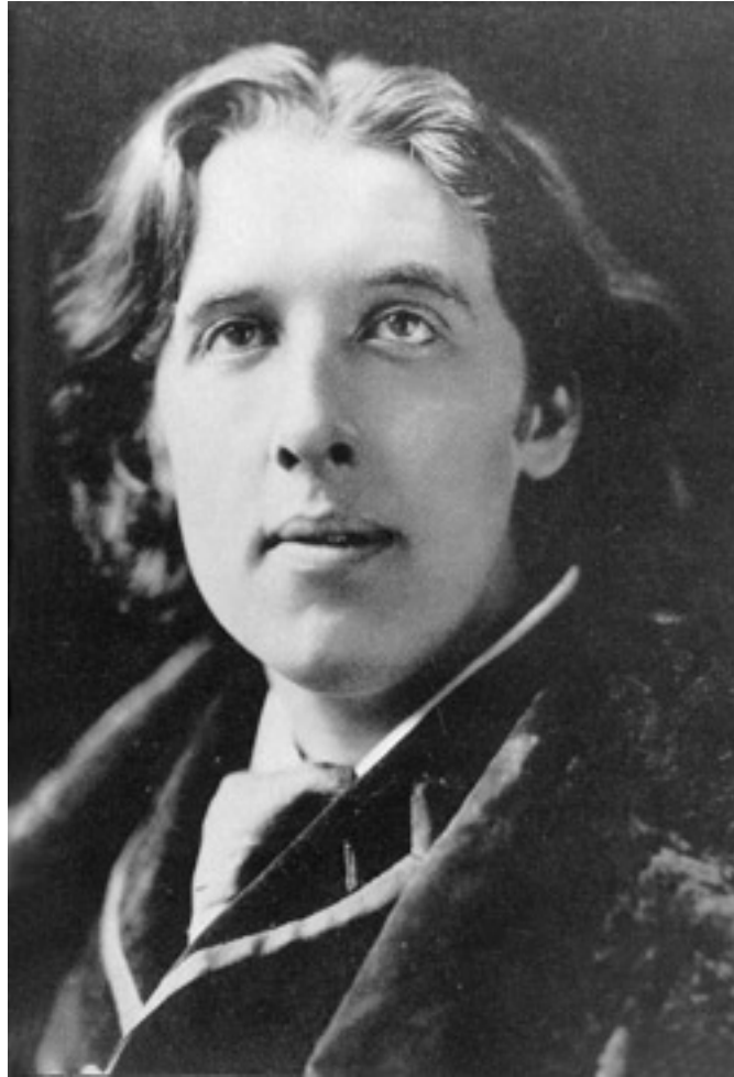
Figura 2 Oscar Wilde