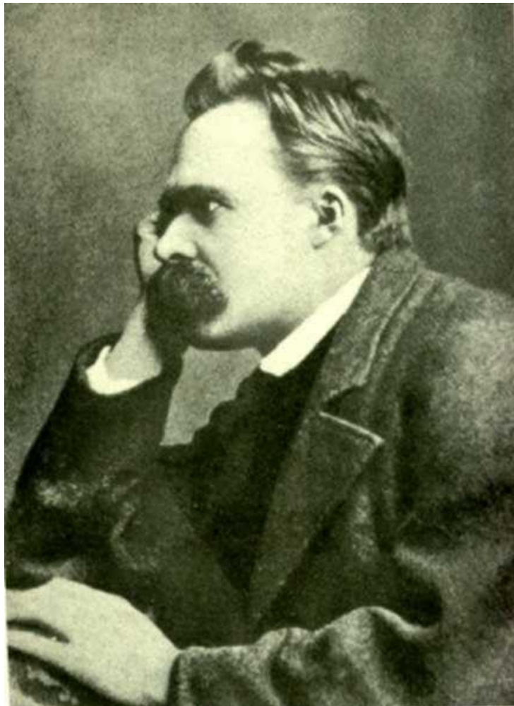
Figura 4 Nietzsche

volontà in Dio) e doveva riappropriarsi della propria dignità umana, affermando se stesso.