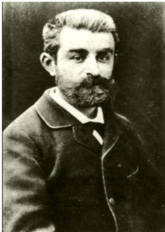
Figura 1 Karl Huysmans

Col suo primo romanzo, Il piacere (1889), D'Annunzio inaugura in Italia la fase del romanzo psicologico ed estetizzante . Il protagonista è Andrea Sperelli, un giovane nobile romano. Dopo la relazione, fatta di sensualità esasperata, con Elena Muti, il giovane si tuffa in una serie di avventure galanti nel bel mondo, tra cui un duello in cui viene ferito. Durante la convalescenza, conosce una dama di nobili sentimenti, Maria Ferres: ma preso dal ricordo della passione precedente, si lascia sfuggire il nome di Elena mentre è tra le braccia di Maria che fugge sconvolta. Andrea Sperelli può essere confrontato con l'aristocratico Des Esseintes, protagonista del romanzo Controcorrente (1884) di Karl Huysmans .