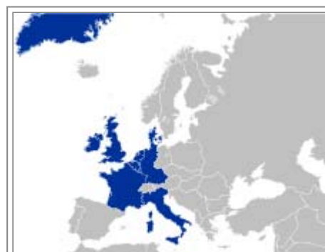
Comunità europea 1973

Categorie: Politica, Diritto e Organizzazioni internazionali Portale Europa - Progetto Europa