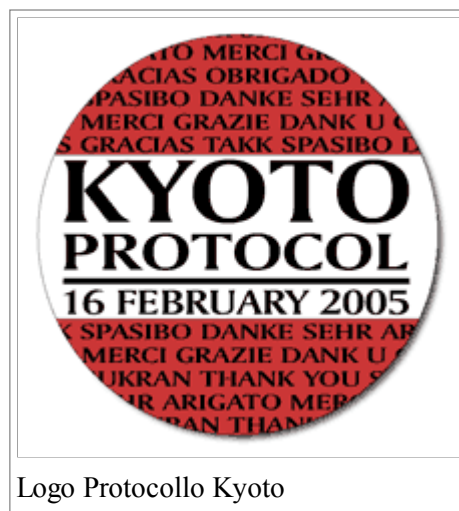
Logo Protocollo Kyoto