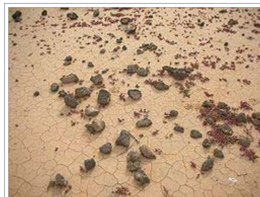
L'aridificazione precede sovente la desertificazione